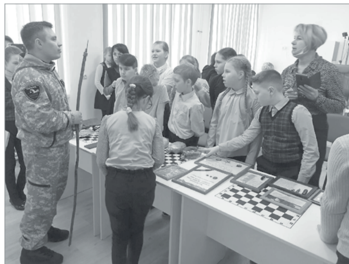
Детям – о работе поисковиков