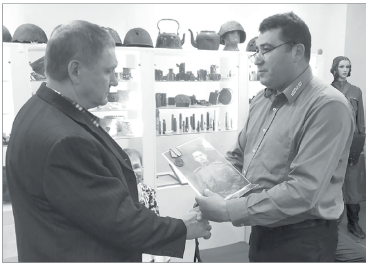
Сыну передали боевую награду отца