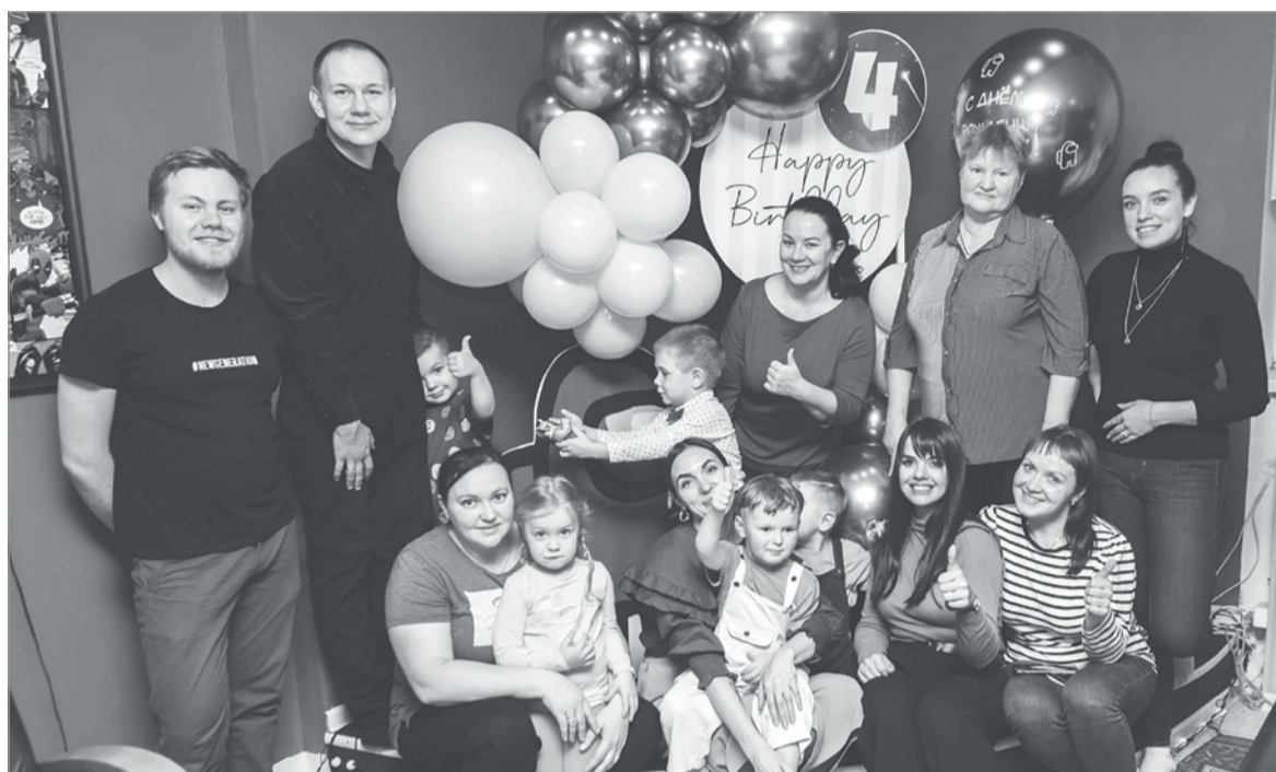
В декабре антикафе отпраздновало свой первый день рождения

Итак, идём в «Хорошее место» за впечатлениями! Оно расположено в торговом центре «Ирина», что находится на пересечении проспекта Ленина и улицы Карла Маркса. Входим с торца здания, поднимаемся на второй этаж, идем до конца коридора и... видим почти домашнюю обстановку. Непременно на входе нужно раздеться и снять обувь, потому что везде теплые полы, покрытые натуральными коврами. А еще много света и улыбок.