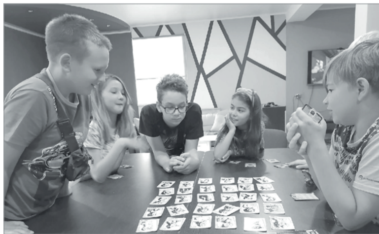
Детям, подросткам и молодежи здесь есть чем заняться – игр хватает на всех