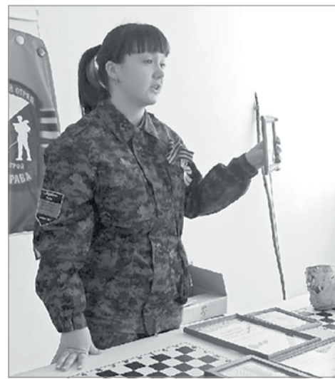
«Я видела последствия той страшной войны»